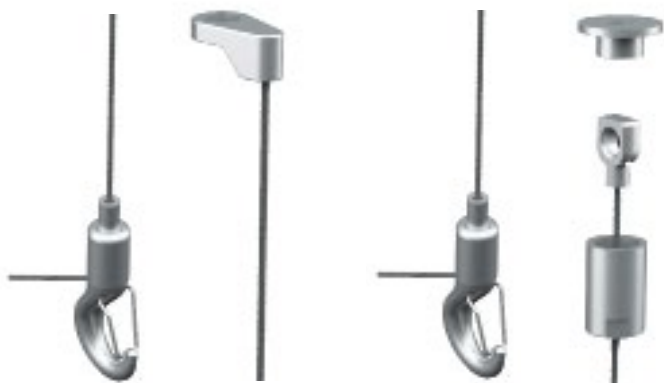
WIREKITS - KLASSISK LØSNING

Vi har udviklet to nye wirekits, som er ideelle til vores Rockfon Eclipse® flådeløsning.